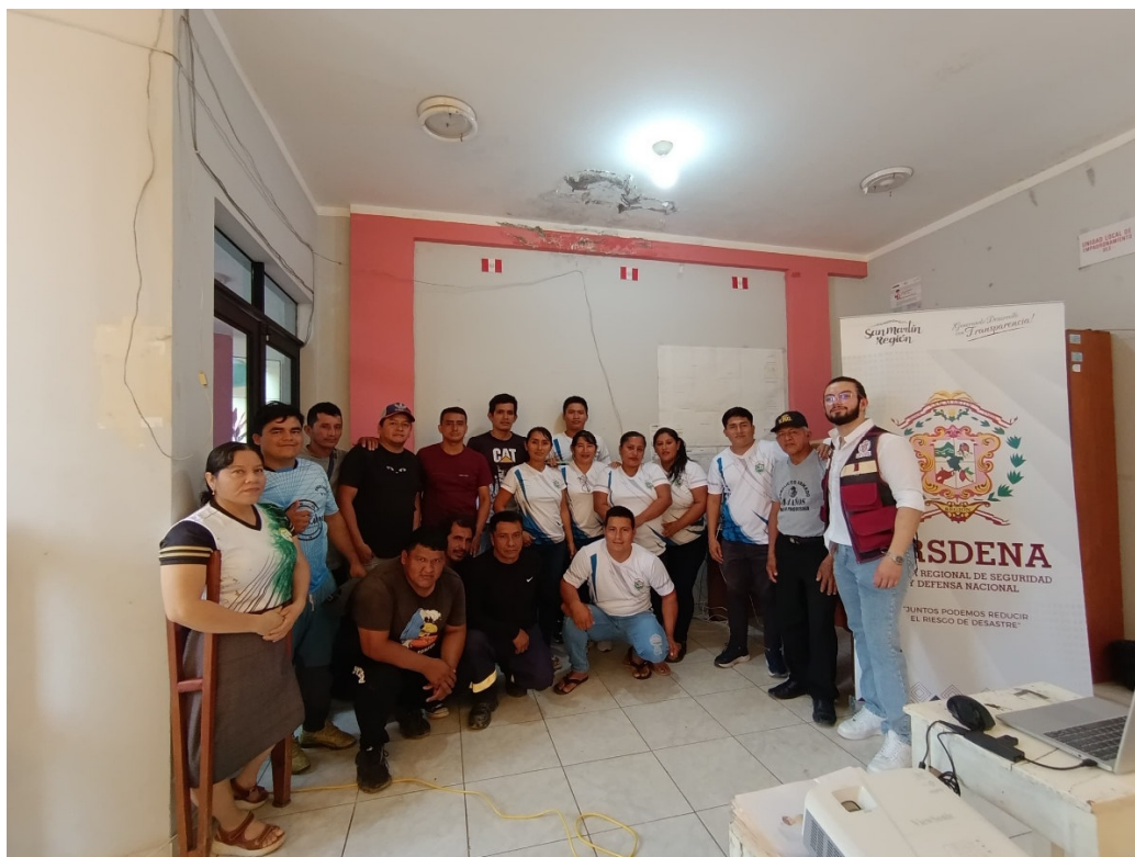
Imagen N° 01: Asistencia Técnica “Elaboración de Planes de Prevención y Reducción del Riesgo de Desastres ante Inundaciones, Movimientos en Masa e Incendios Forestales” (10/4/2025) a la Municipalidad Distrital de Tres Unidos.